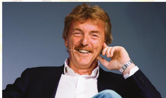
Zbigniew Boniek Prezes Polskiego Związku Piłki Nożnej